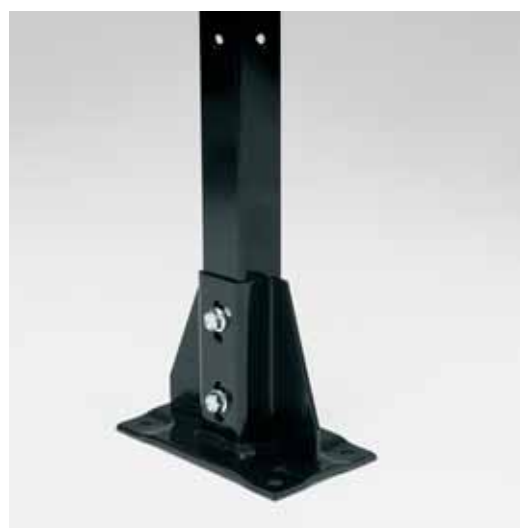
Justerbar fot +/- 10 mm